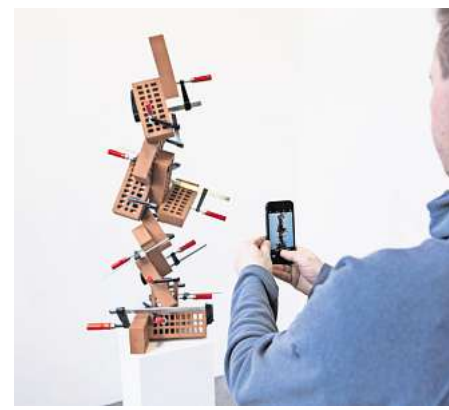
Benjamin Sabatiers „Briques III“ bei The Grass is Greener.