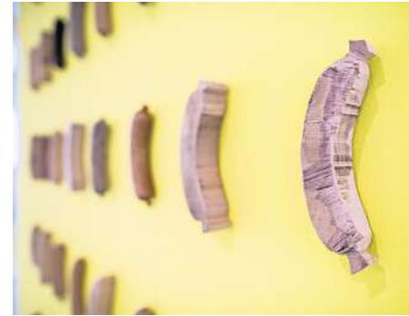
Sebastian Neebs Kunst-Würste bei Reiter.